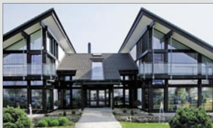
Glasklar: das Firmengebäude von BCT in Willstätt

Die BCT Technology AG hat ihren Firmensitz in Willstätt, ganz in der Nähe der Europa-Stadt Straßburg. Gegründet wurde das Unternehmen im Jahr 1991 als Spin-off der Unternehmensgruppe Badische Stahlwerke GmbH in Kehl (BSW). Die BSW zählt zu den leistungsfähigsten Elektrostahlwerken der Welt. Zur Unternehmensgruppe gehören neben BCT auch weitere Unternehmen aus verschiedenen Branchen: Engineering, Energieberatung, Anlagenbau sowie Aus- und Weiterbildung. Für die Kunden der BCT Technology AG bedeutet die Einbindung in diese finanzstarke Gruppe natürlich eine sehr hohe Investitionssicherheit .