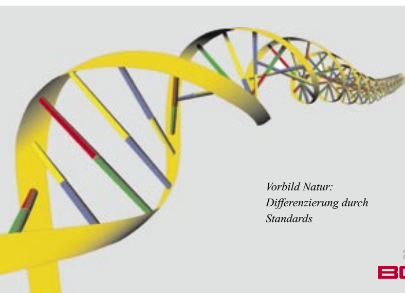
Vorbild Natur: Differenzierung durch Standards